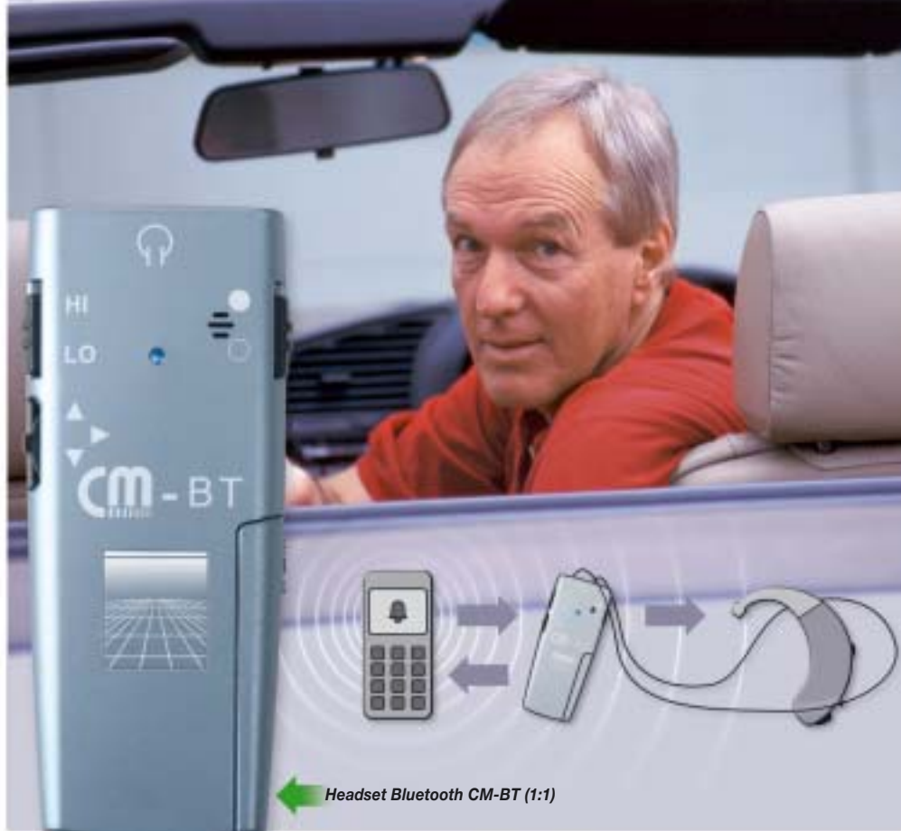
Headset Bluetooth CM-BT (1:1)

Le set CM-BT avec pochette de rangement robuste comprend le headset Bluetooth, la boucle magnétique et une pile. Une station de charge pour accu CM et des oreillettes stéréo discrètes sont proposées en option.